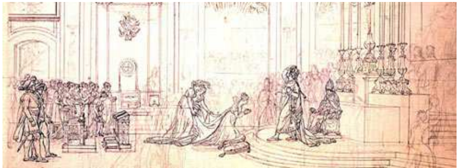
Étude perspective pour Le sacre de l'empereur Napoléon Ier et le couronnement de l'impératrice Joséphine le 2 décembre 1804

Paris, musée du Louvre, département des Arts graphiques